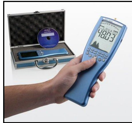
נתוני מכשיר אארוניה:

מכשיר מדויק בעל רגישות גבוהה, טווח מדידה רחב ויכולת לאגור נתונים.