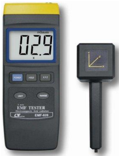
מכשיר לוטרון EMF-828 עם גלאי חיצוני